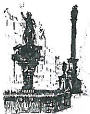
Rynek Fontanna z Neptunem