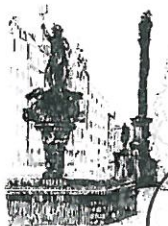
Rynek Fontanna z Neptunem

Zmiana obszaru Strefy Płatnego Parkowania leży w kompetencji Rady Miejskiej.