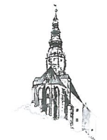
Kościół pw. Św. Stanisława i Św. Wacława Katedra Diecezji Świdnickiej

W odpowiedzi na interpelację nr XLI -1450/18 z dnia 22.02.2018 w sprawie rozwiązania problemu przejścia pomiędzy ulicą Jodłową i Okrężną wyjaśniam, że wykonanie nawierzchni z destruktu bitumicznego zaplanowaliśmy na pierwsze półrocze bieżącego roku.