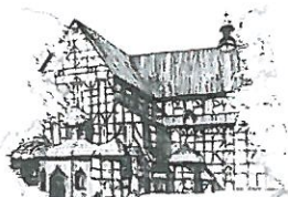
Kościół Pokoju pw. Św. Trójcy Wpisany na listę UNESCO

W odpowiedzi na interpelację nr XLI -1450/18 z dnia 22.02.2018 w sprawie rozwiązania problemu przejścia pomiędzy ulicą Jodłową i Okrężną wyjaśniam, że wykonanie nawierzchni z destruktu bitumicznego zaplanowaliśmy na pierwsze półrocze bieżącego roku.