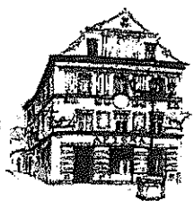
Kamienica „Pod Bykami”

W załączeniu przekazuję odpowiedź na zapytanie Nr 715/13 z dnia 19.04.2013r. dotyczące wymiernych efektów projektu „Miejskie trasy turystyczne zintegrowanym produktem turystycznym miast czesko – polskiego pogranicza”, przekazaną przez Regionalną Informację Turystyczną i Kulturalną w Świdnicy.